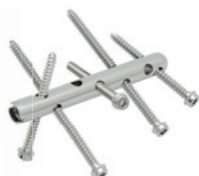
E.8 HŘEB PATNÍ C-NAIL